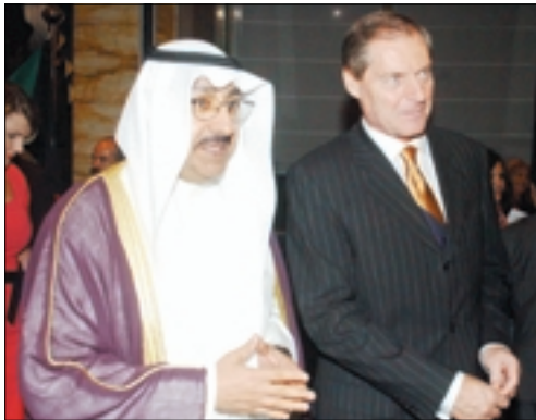
الشيخ علي عبد الله الاحمد والسفير بلازيك